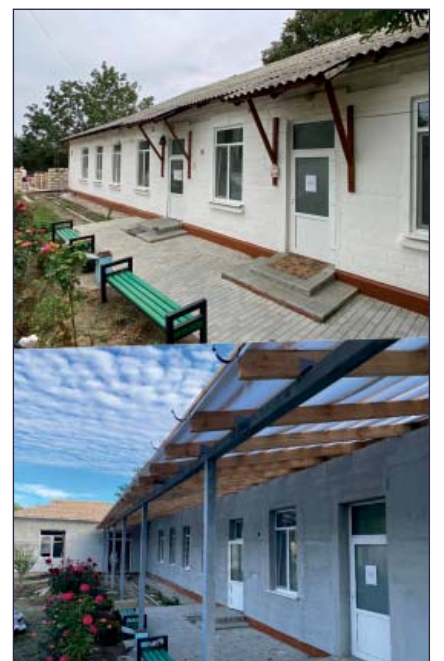
Grădinița-171 (sectorul Hamzeu): Lucrările de reparație capitală a Grădiniței nr. 171

Lucrările prevăd reparația capitală a acoperișului (termoizolarea, lemn nou, țiglă metalică), canale de ventilare, lucrări la fațadă (tencuială, termoizolare, vopsire,