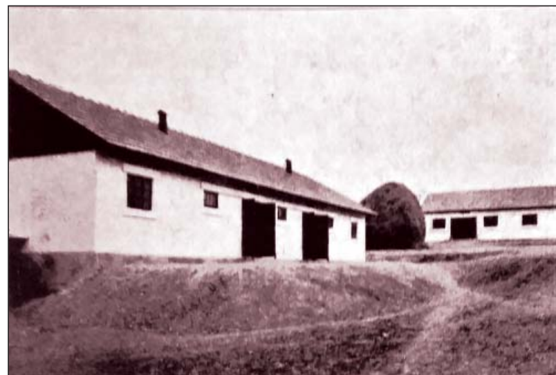
Gospodăria comunală Băcioi