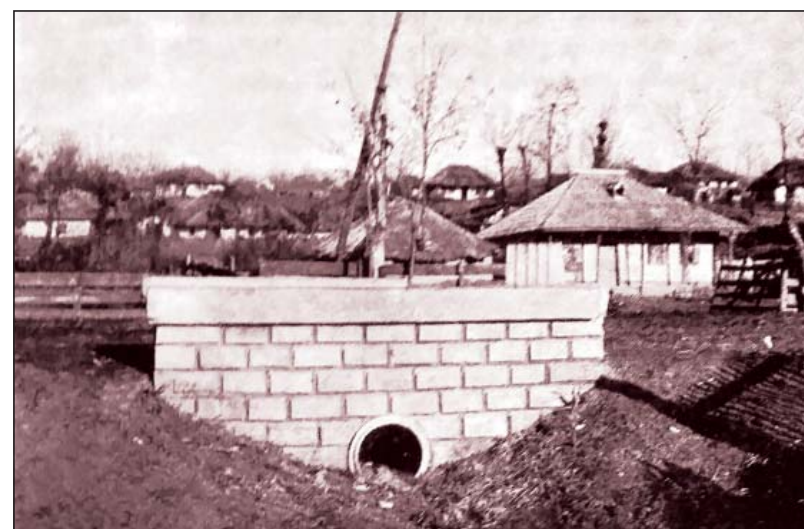
Podet tubular pe șoseaua Băcioi