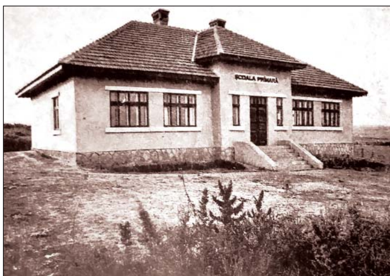
Școala Primară „Dr. C. Angelescu” din comuna Băcioi