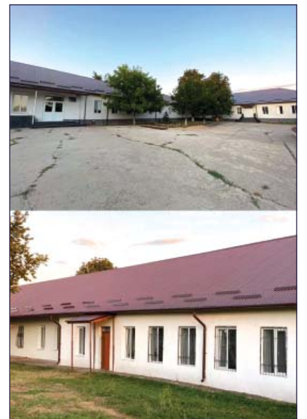
Schimbarea capitală a acoperișului vechi din ardezie cu unul de țiglă metalică pe un perimetru de 2 600 m 2 la Școala Primară nr. 101 din s. Băcioi

înlocuirea verandei cu construcția unei anexe noi ce vor cuprinde: vestiar, sală, cabinet de proceduri, cabinet, izolator, tambur), alte lucrări.