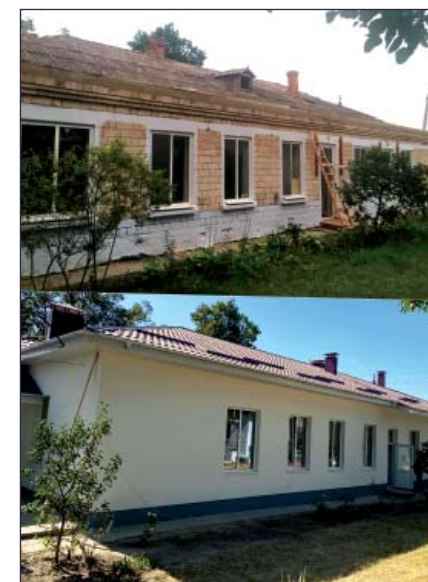
Ultima etapă a lucrărilor de reparație capitală a Grădiniței nr. 101 (sec. Străisteni), com. Băcioi

Proiectul este finanțat din surse locale și municipale. Valoarea totală a lucrărilor este de 1 058 766 lei, dintre care 700 000 lei reprezintă finanțarea din bugetul municipal și 358 766 lei din bugetul local.