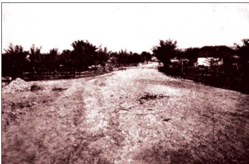
Șoseaua din com. Băcioi

S-a distribuit în anul 1936 școlii din Băcioi, zece bănci școlare confecționate la gim-