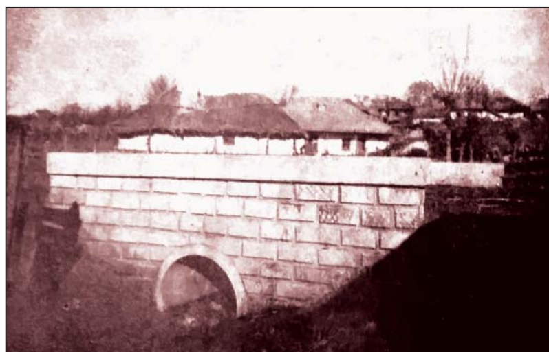
Podet tubular pe șoseaua Băcioi