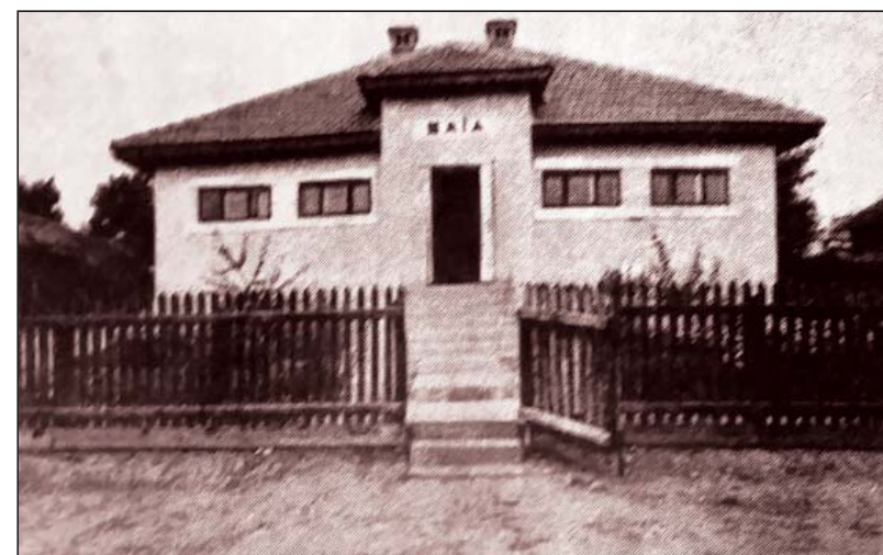
Baia comunală Băcioi

naziul industrial din Văsieni, în valoare de 6.000 lei.