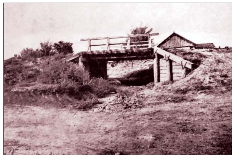
Podul pe șoseaua Băcioi