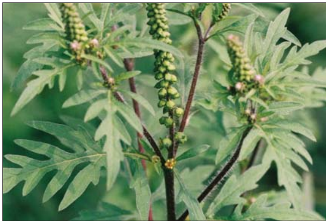
Ambrozia (Ambrosia) este un gen de plante erbacee, sau de arbuști, aparținând familiei Asteraceae

În legătură cu răspândirea plantei invazive ambrozia, expunerea la polenul căreia este periculoasă pentru sănătatea multor oameni, Primăria com. Băcioi face apel la conștiința cetățenilor privind îndeplinirea măsurilor de combatere a acestei buruiene de carantină.