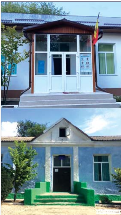
Lucrările de reparație capitală a Gimnaziului nr. 102 din s. Brăila, com. Băcioi

Crearea unui mediu educațional confortabil și creșterea competitivității instituțiilor educaționale locale, acestea sunt obiectivele pe care și le pune Primăria com. Băcioi investind în proiectele de renovare a infrastructurii